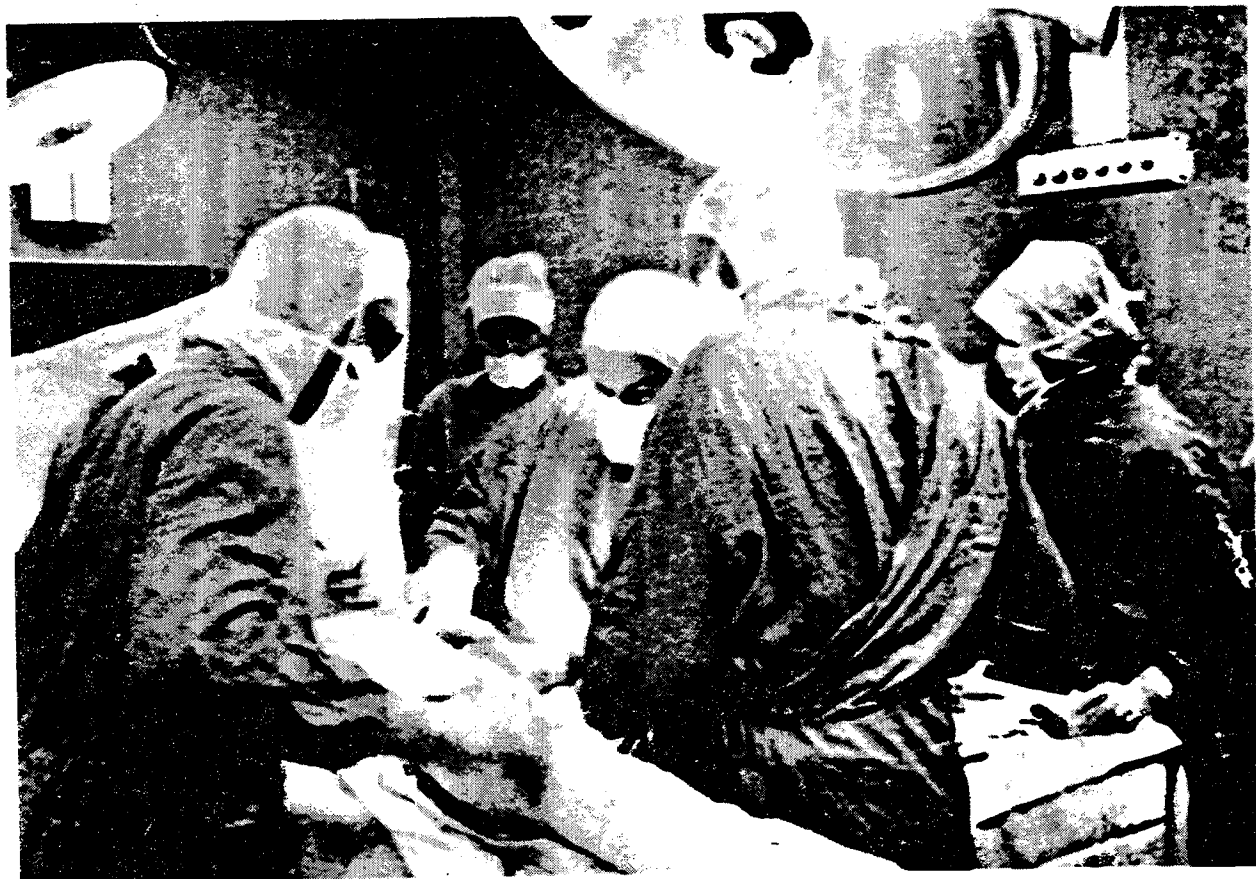
Operace ve vojenské nemocnici Surgery at a military hospital