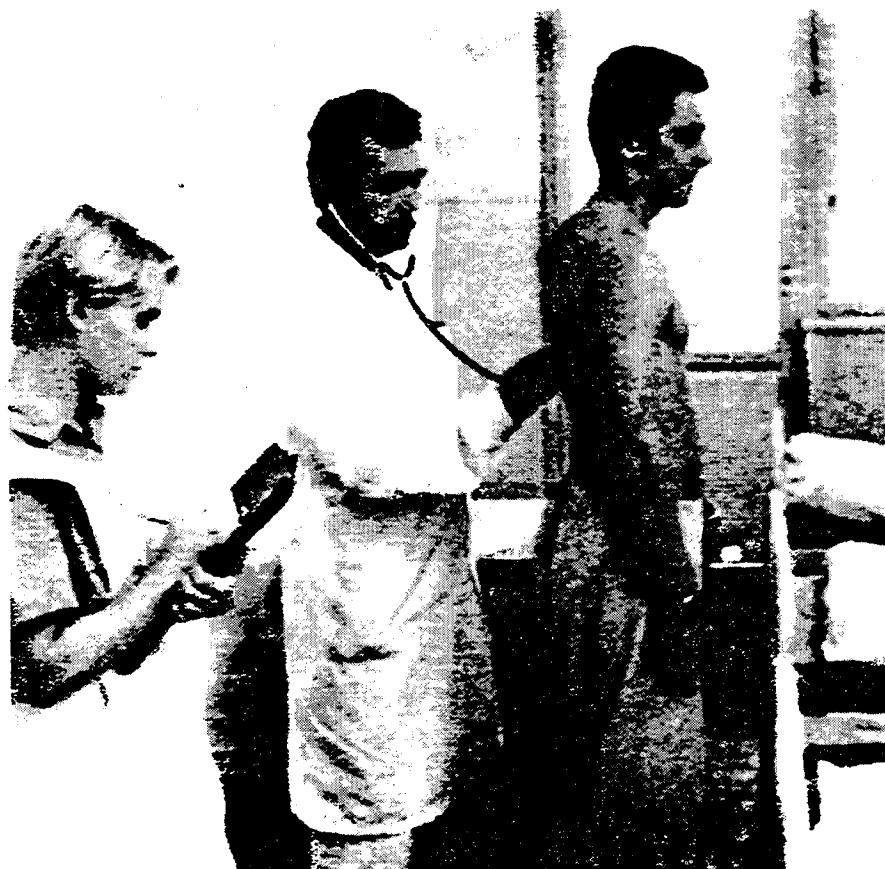
Lékařská visita v nemocnici Doctor's rounds in the hospital