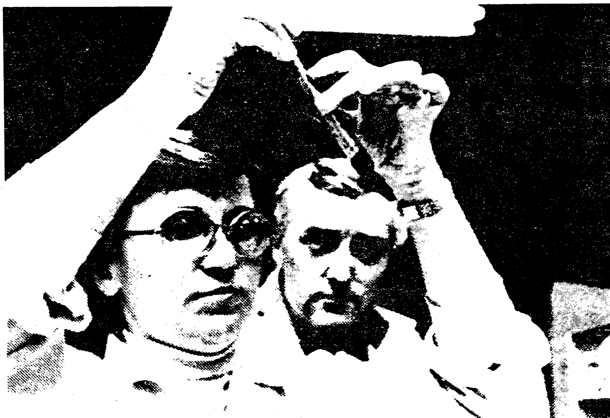
Rozbor krve v laboratoři Blood analysis in the laboratory

Instructions: On tape you will hear 10 questions in Czech. These questions are based on information from Study Resource 2. Write answers in English to these questions. You may refer to the study resource as necessary.